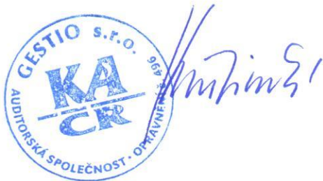
GESTIO s.r.o. Praha 10, Na Palouku 3219/3 auditorské oprávnění č. 496